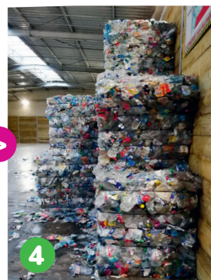
4 Conditionnement et stockage des matériaux en balles

Ce nouveau centre de tri est aujourd'hui équipé pour trier tous les emballages . Il permet de traiter jusqu'à 30 000 tonnes issues de la collecte sélective par an. Désormais, sont triés sur place les petits éléments métalliques ainsi que tous les emballages en plastique (y compris les pots de yaourt, de crème fraîche, les films en plastique et les barquettes...), tandis que seuls les flacons et les bouteilles en plastique étaient triés dans