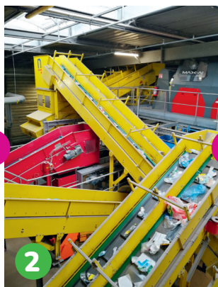
2 Séparation automatique des différents types de déchets